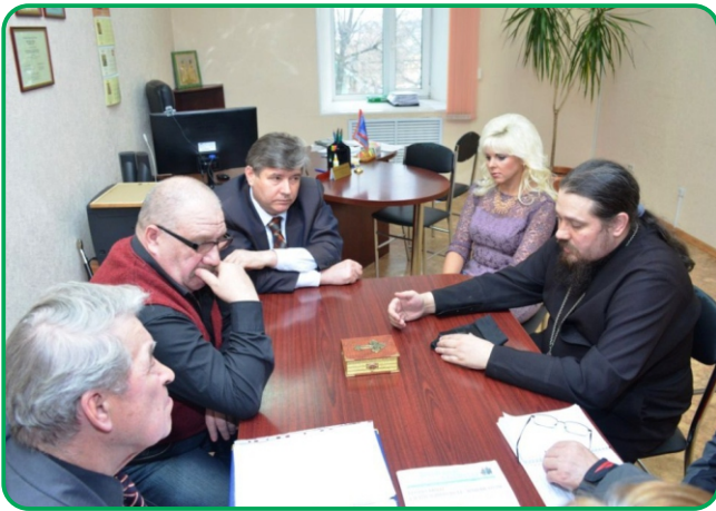
В Первом Казачьем университете состоялась встреча, посвященная празднованию 70-летия Победы в Великой Отечественной войне

2 апреля в Первом Казачьем университете им. К.Г. Разумовского г. Пензы состоялась встреча по поводу конференции, которая пройдет 21 апреля и будет посвящена празднованию 70-летия Победы в Великой Отечественной войне.