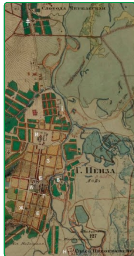
Пенза и ее ближайшие пригороды в середине XIX века. Фрагмент карты Генерального межевания А.И. Менде.

Не смотря на недостаток фактического материала и некоторых издержек в датировке, со строительством московского военной крепости и, позднее, в круг нее города, все здесь в достаточной мере предсказуемо и конкретно. История же, предшествующая крепостному строительству, и до сей поры крайне туманна, запутана и спорна. Ни труд Хвощева, ни более поздние работы историков не дают сколь ни будь приемлемых объяснений ряду немало-важных фактов из истории освоения пензенского края.