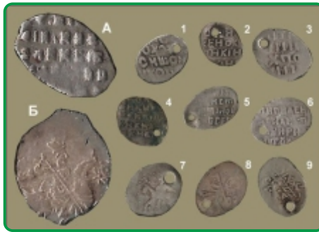
Изделия фальшивомонетчиков XVII века.

вым, на нее же обращал внимание и В.М. Потин, возглавляющий в наши дни нумизматический отдел Государственного Эрмитажа. Из текста ее следует, что значительный процент населения нового города состоял из амнистированных фальшивомонетчиков, для которых суровая казнь через заливание горла расплавленным металлом была заменена государевой службой в этом неспокойном краю.